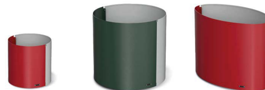
DUO C - 450

Collection of circular and elliptical planters composed of two half-shells and a base, made of folded steel sheet, with adjustable support feet. The planters are available in corten steel, with a special sandblasting and oxidation cycle, in brushed stainless steel, and in steel. All metal parts are galvanised and coated with thermosetting polyester powder, also two-tone (except for corten steel and stainless steel versions). All fixings are in AISI304 stainless steel. Freestanding with adjustable feet for levelling.