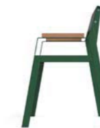
CASTEO SENIOR - M - W - TW - WPC